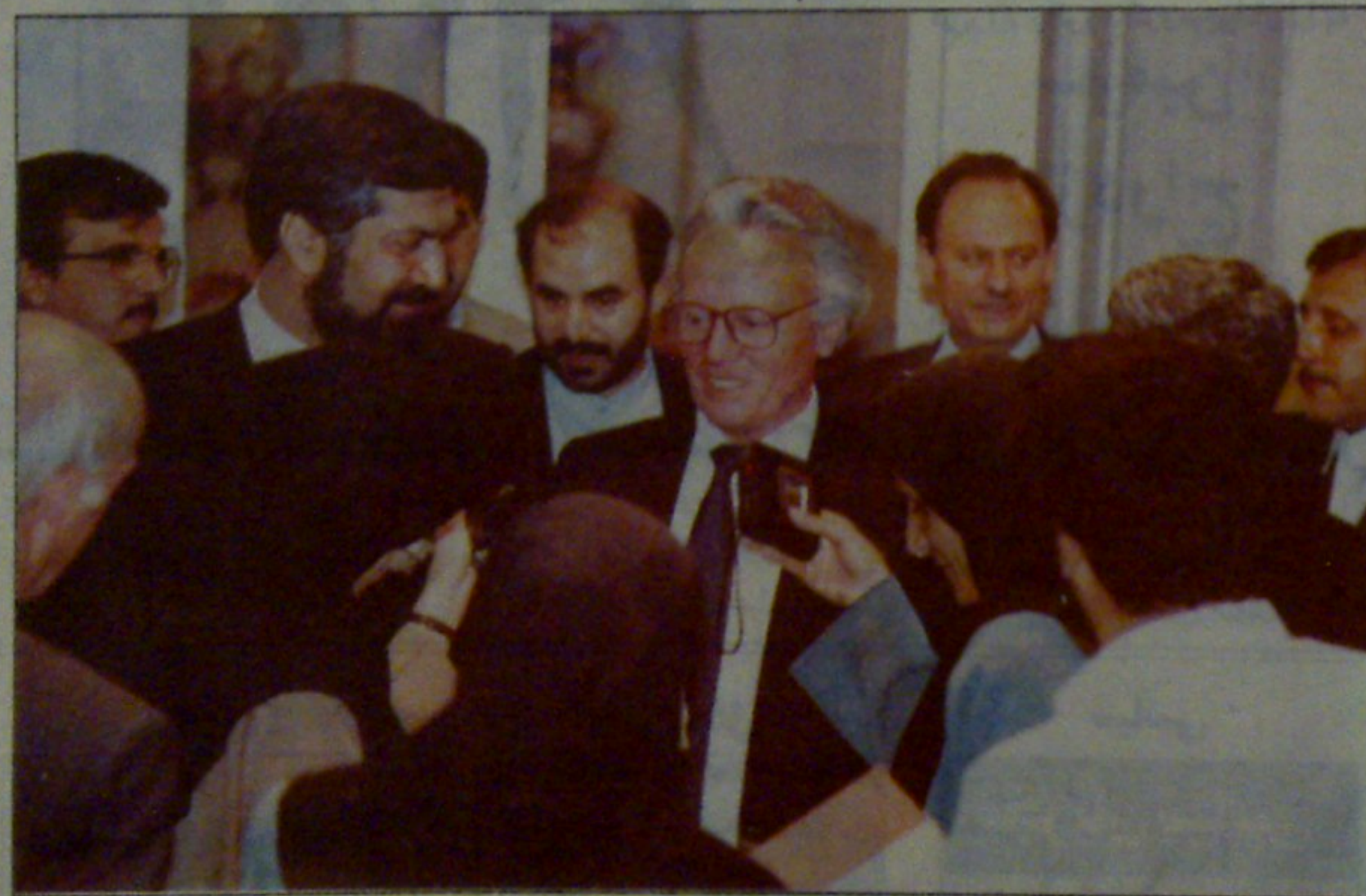
آلبرت روحان در پایان مذاکرات به سئوالات خبرنگاران پاسخ گفت

معاون وزیر امور خارجه اتریش تنوع موضوع های مورد بحث را نشانگر جامع بودن گفت و گوها دانست و افزود: «ما تأکید کرده ایم که با حسن نیت خواستار ادامه گفت و گوهای جدید با ایران هستیم».