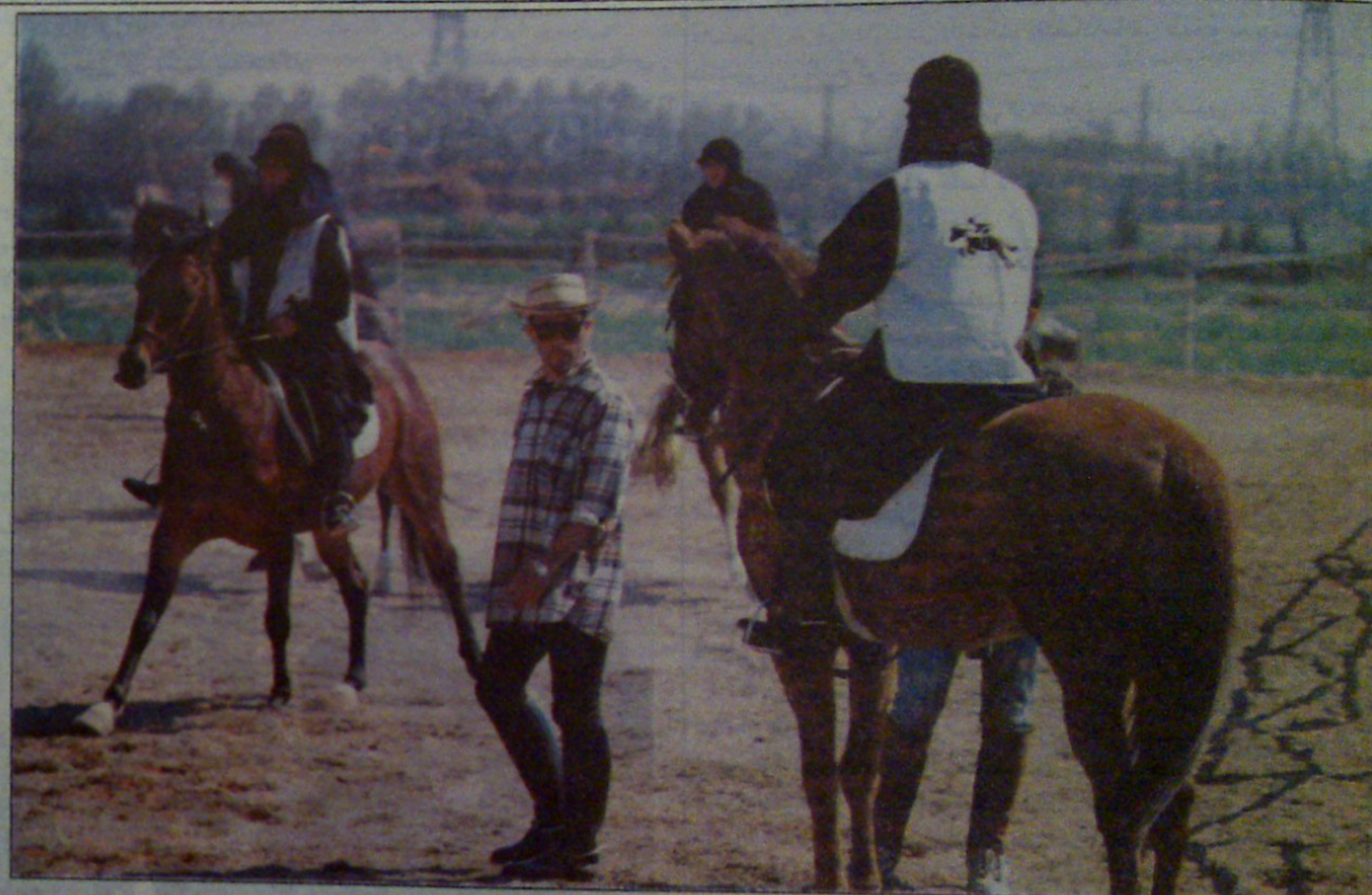
دختران سوارکار در راه تایلند - از عمر سوارکاری در بین دختران ایرانی اگرچه مدت زیادی نمی‌گذرد ولی این رشته به خوبی توانسته جای خود را در میان این گروه بیابد. اگر بخت یاری کند، امسال دختران سوارکار ایرانی در رقابتهای دوساژ قهرمانی آسیا در تایلند شرکت خواهند کرد.

سخنگوی دولت موسوی لاری رأی اعتماد خواهد گرفت